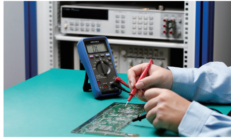
高精度真有效值测量，精准可靠