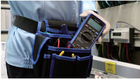
轻巧机身，功能齐全